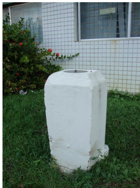
Data de foto: Maio de 2017

Monografia elaborada em (Souza, 2017) - PIBIC - Propesq / UFPE