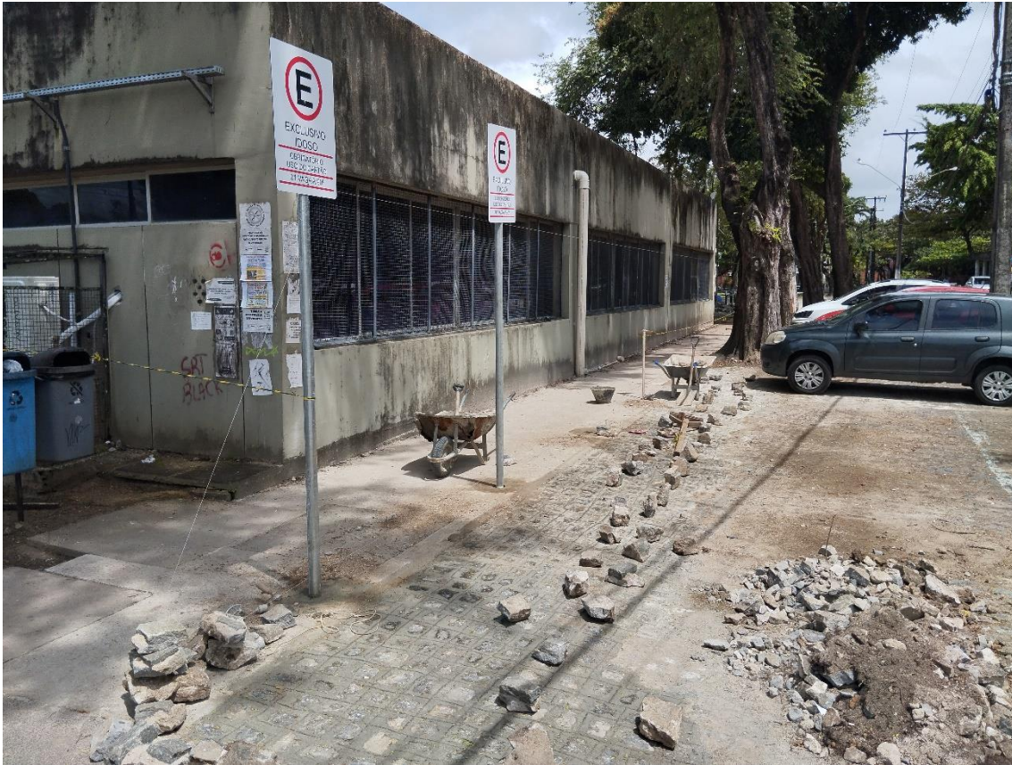
Execução de vagas acessíveis e instalação de placas