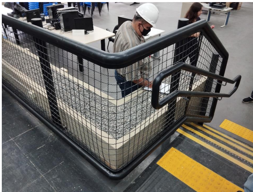
Biblioteca: Escada com guarda corpo e corrimão