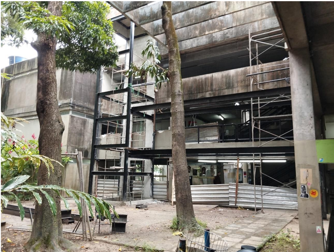
Estrutura metálica do elevador e passarela