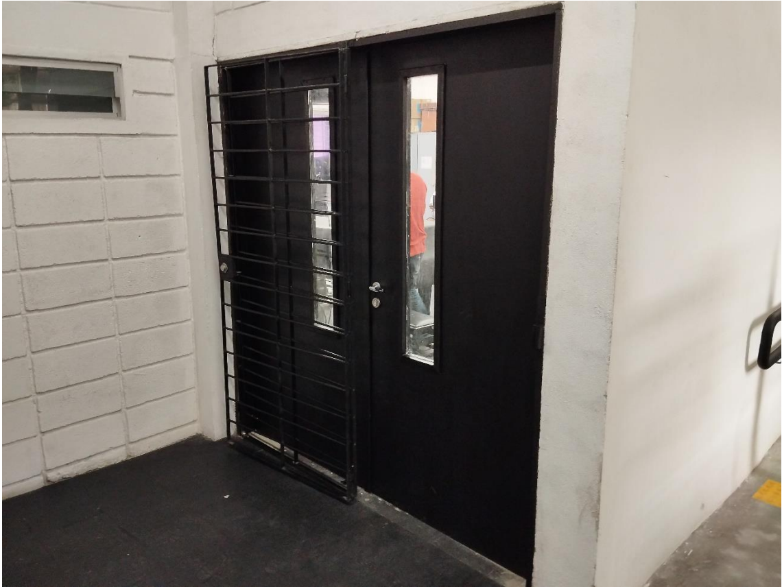
Sala de Música: Instalação de porta