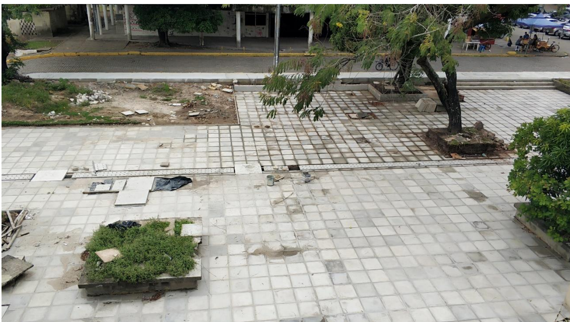
Calçada e piso em lajota da área externa