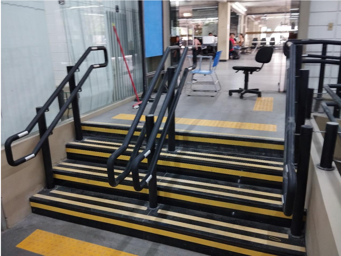
Biblioteca: Escada com corrimão