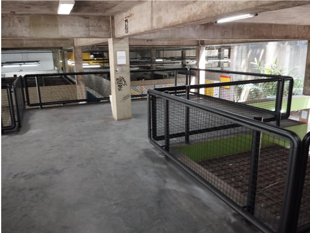
Instalação de guarda corpo na laje em cima da cantina