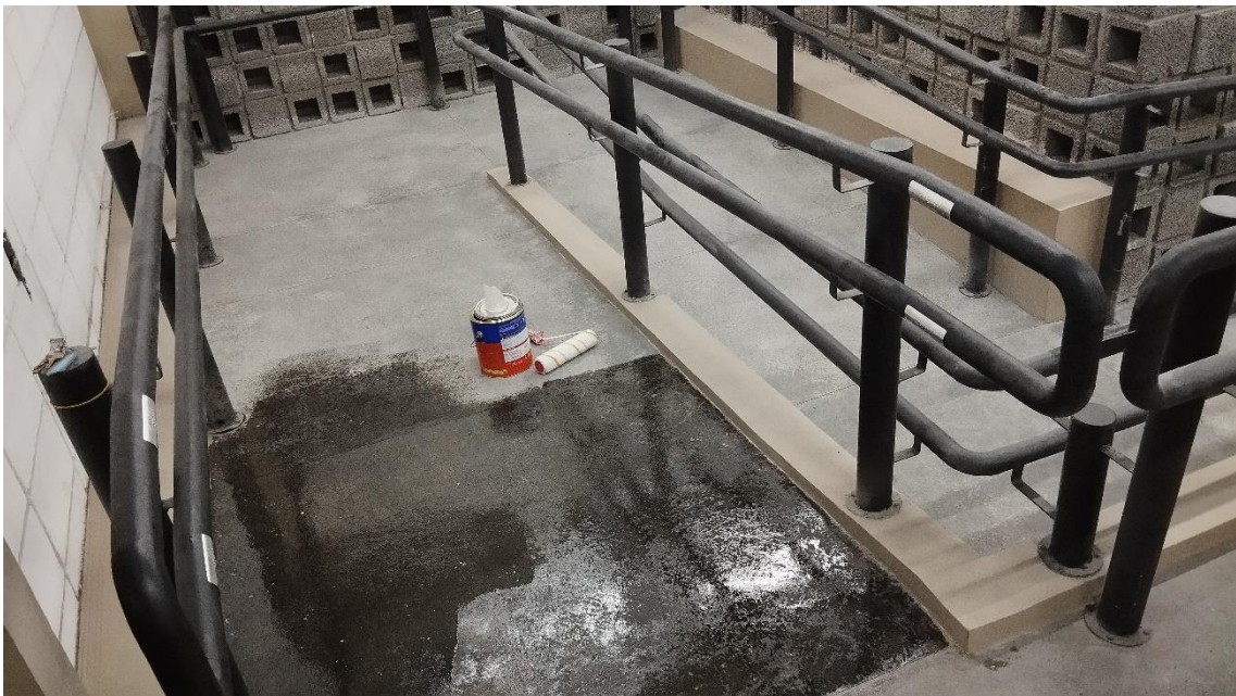
Biblioteca: Rampa com corrimão