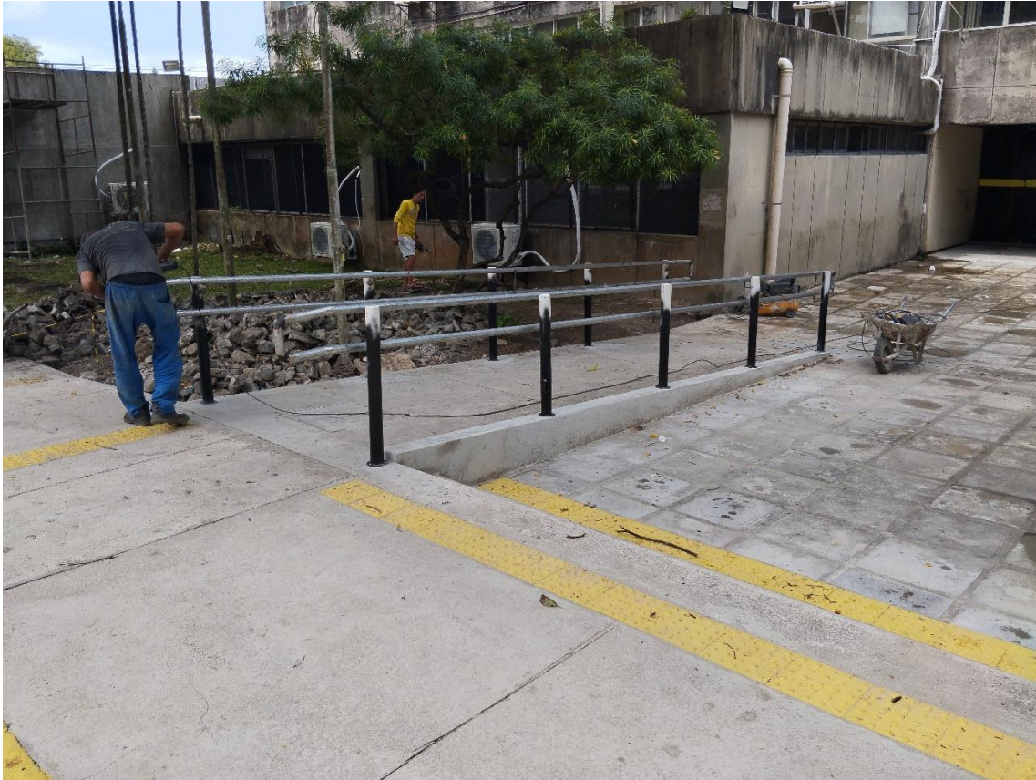
Construção de rampa e escada, instalação de corrimão e piso tátil