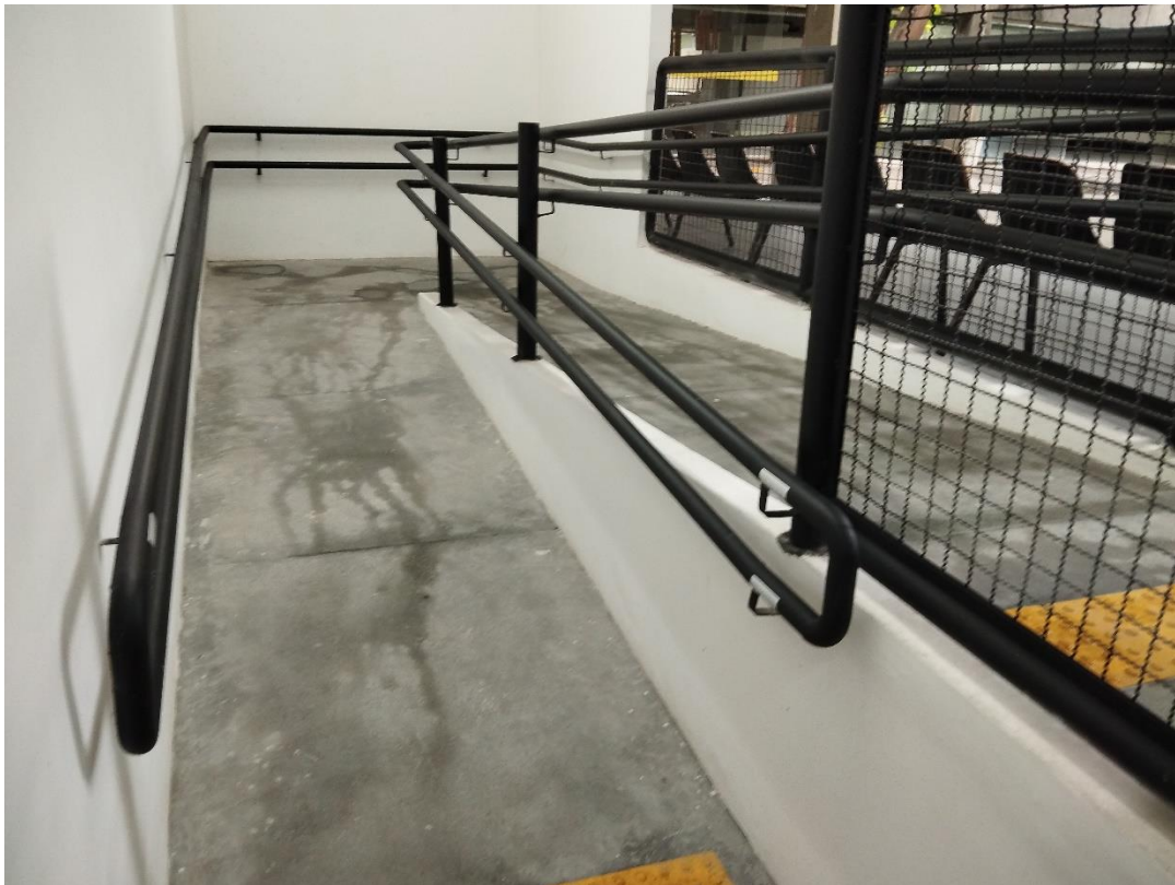
Rampa com corrimão e guarda corpo no departamento de música