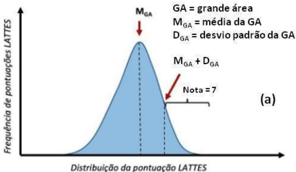
Figura 1 – Descrição gráfica da estimativa da nota do currículo lattes do docente para inscrições Pibic frente sua Grande Área de conhecimento (a), e do currículo lattes do docente para inscrições Pibiti frente sua Macroárea de conhecimento (b).