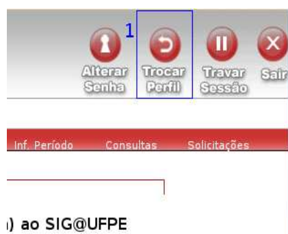
Figura 1 – Botão Trocar Perfil.

Para acessar as funcionalidades do PIBIC, deve-se primeiro trocar o perfil funcional clicando no botão que fica na parte superior direita da tela “Trocar Perfil”(1), na Figura 1. Logo aparecerá uma tela onde estão todos os perfis que você, como parte do corpo acadêmico de sua instituição, pode acessar. No caso, atente-se ao perfil que possui o módulo “PESQUISA”(2).